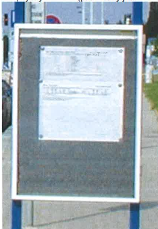
varianta SJŘ S6 s mechovkou