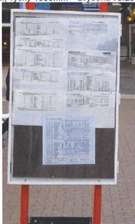
varianta SJŘ SXV s mechovkou

šířky 630mm, výšky 1000mm – zvýšená verze typu S6V