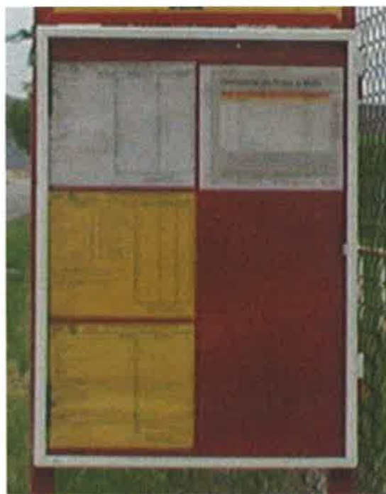
varianta SJŘ S6 s vloženým zakladačem jízdních řádů